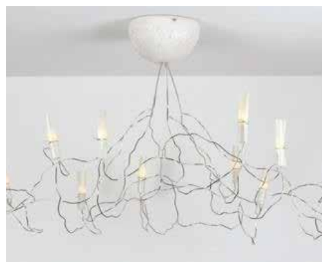
Lustre Sauvageon © Véro & Didou