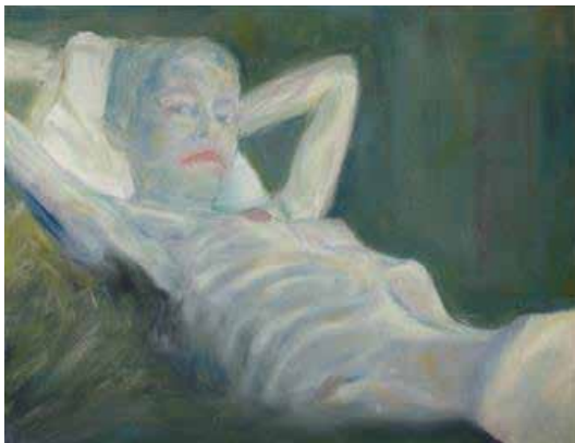
Nous ne sommes définitivement pas les derniers Huile sur toile, 50 x 65 cm © Franck Leviski

Exposition du 15.09.18 au 27.10.18 Vernissage : samedi 15 septembre à partir de 16h : présentation de l'exposition par l'artiste suivie d'un buffet de projections autour du travail de Franck Leviski Atelier famille : samedi 27 octobre à 15h + Samedi 24 novembre : Le car est ouvert Entrée libre tous les jours de 15h à 19h St-Médard-d'Excideuil | Jardin d'hélys-oeuvre Organisation et renseignements Les amis du jardin d'hélys | 05 53 52 78 78