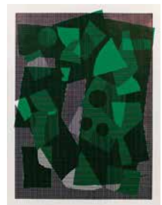
Fantôme, 2016, encre et adhésif sur papier, 60 x 80 cm © Jean-Marie Blanchet