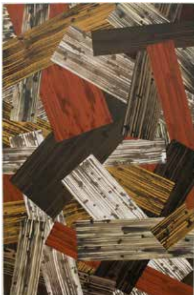
Random, 2014, acrylique sur toile, 110 x 170 cm © Jean-Marie Blanchet

Organisation et renseignements : Association Athéna | 06 83 36 97 86