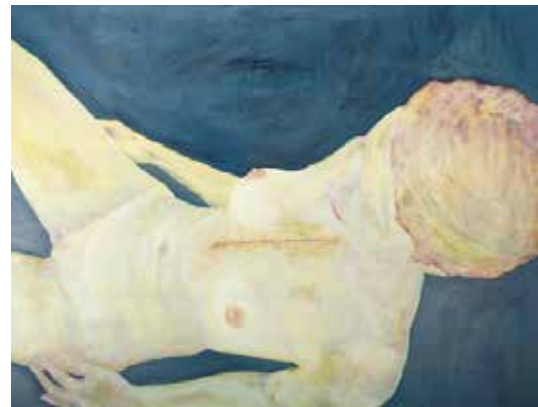
Nous ne sommes définitivement pas les derniers Huile et pigments sur toile, 97 x 130 cm © Franck Leviski