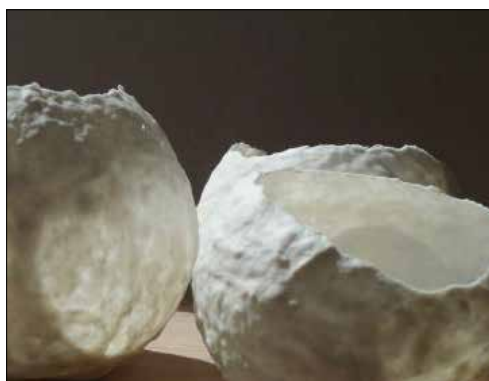
Collection lumière, photophores en porcelaine papier © Patricia Masson