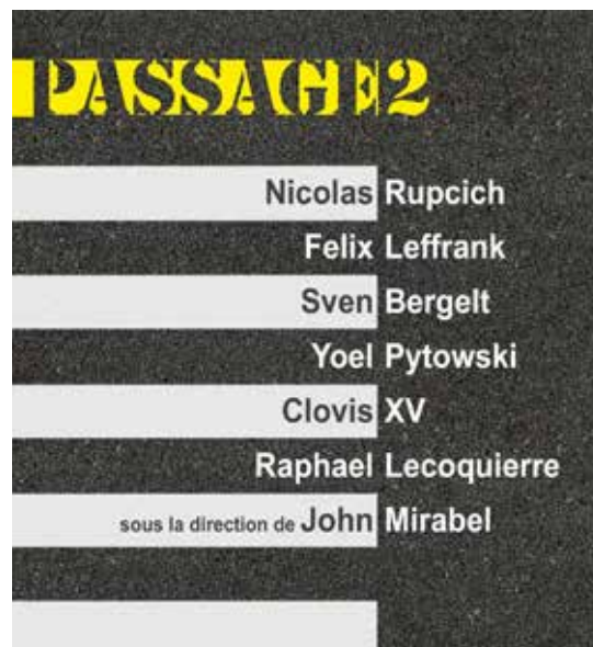
Passage #2 / Conception graphique Audrey Tröndle

Association La Nouvelle Galerie | 06 80 06 69 23