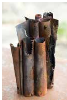
Connexion, émail sur métal © Natacha Baluteau