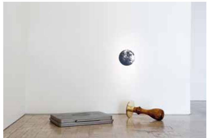
Robin Rhode, Untitled (Moon Stamp + Ink Pad) , 2012