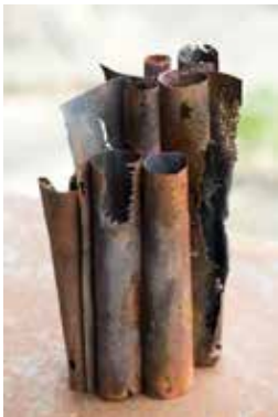
Connexion, émail sur métal © Natacha Baluteau