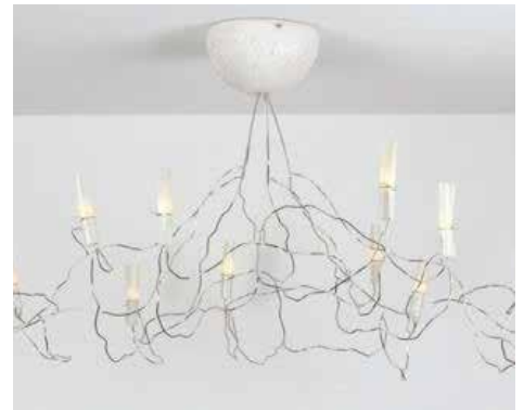
Lustre Sauvageon © Véro & Didou