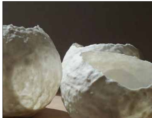
Collection lumière, photophores en porcelaine papier © Patricia Masson